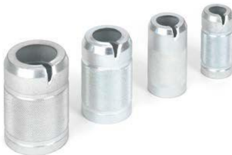
DN 32 oder 1 Zoll